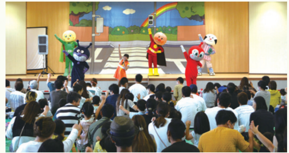
◎やなせたかし/フレーベル館・TMS・NTV

8月20日「JA共済アンパンマン交通安全キャラバン」を、本店で開催し、午前・午後2回の公演に約600人の親子が参加しました。JAでは、「ひと・いえ・くるま」の総合保障を通じて、組合員・地域住民の皆さまが、安心して暮らせる豊かな地域社会づくりを目指しています。この催しは交通安全啓発や交通事故防止活動の一環として行っています。将来を担う子供達は、アンパンマンと仲間たちから歌や踊りを通じて、交通ルールの大切さを楽しく学びました。