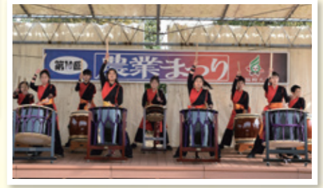
江上校区和太鼓クラス