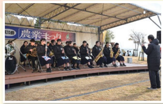
大木中学校 吹奏楽部