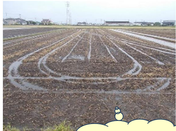
尾輪の跡に水が たまる程度