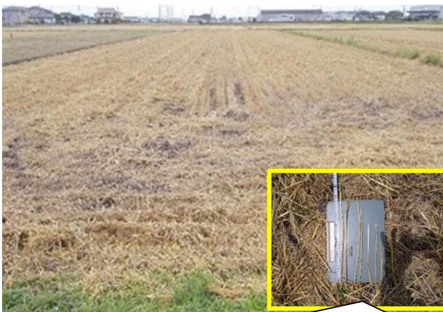
やや長め（20cm程度）に切断