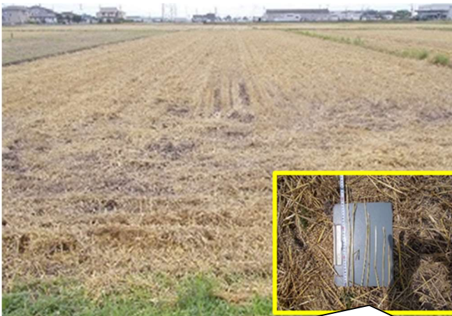
やや長め（20cm程度）に切断