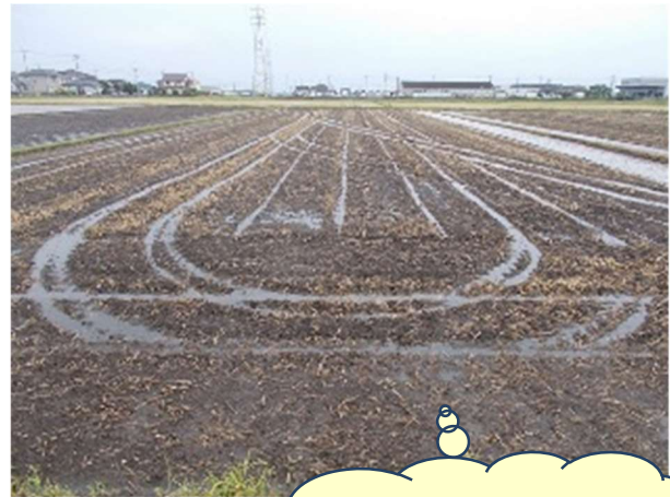
尾輪の跡に水が たまる程度