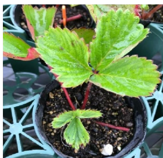
写真3. 被害株 (鉢上げから2週間)