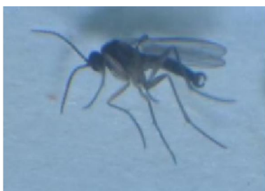
写真1. チビクロバネキノコバエ成虫