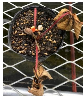
写真4. 被害株 (鉢上げから2週間)