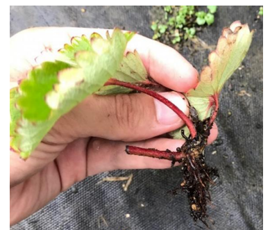
写真5. 根傷みの状況 (鉢上げから2週間)