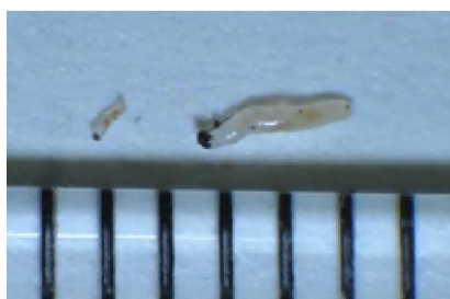
写真2. チビクロバネキノコバエ幼虫